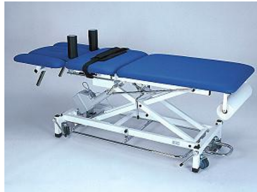
Abb. mit Zubehör: Rad-Hebe-System (Mod. 045), Fußauslöserahmen (Mod. 095), Kopfteil 3-teilig (Mod. 056), Gurtführungsschienen (Mod. 030), zusätzlich mit: Papierrollenhalter (Mod. 010F), Schulterfixierstützen (Mod. 074), Befestigungsgurt (Mod. 035), Gurtpolster (Mod. 034), Gurtführungsschienen (Mod. 030)