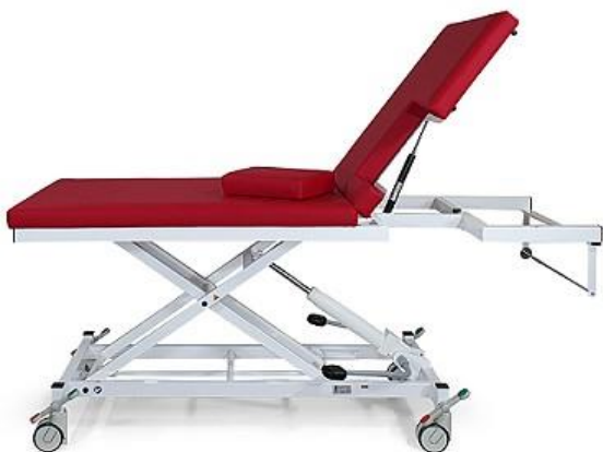
Abb. 2550-00XL/H mit Ausstattungsoptionen: Fahrbar auf zentral feststellbaren Doppelrollen (1180N), Kopfteilverstellung durch Gasdruckfeder (1655)