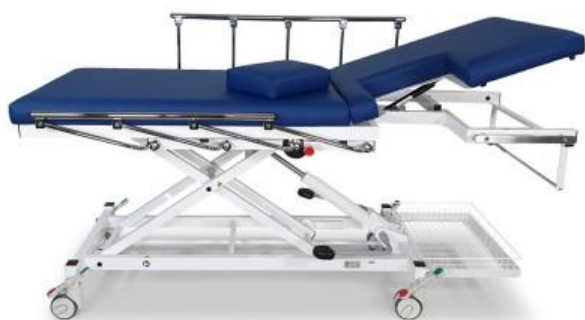
2550-00XL/H mit Ausstattungsoptionen: Fahrbar auf zentral feststellbaren Doppelrollen (1180N), Normschiene (1410), seitlich versenkbare Seitengitter (1080), Papierrollenhalter (1270K), Kopfteilverstellung durch Gasdruckfeder (1655)