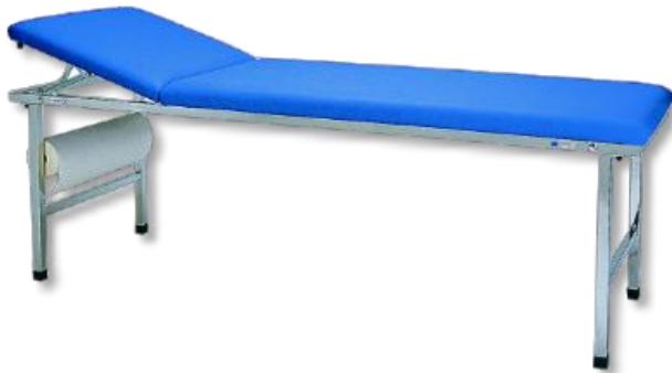
22-01 mit Ausstattungsoption: Papierrollenhalter (1210)