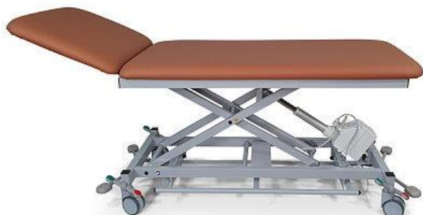
Abb. mit Zubehör: Rollen einzeln feststellbar 100 mm diam., (4x Mod. 1120), Papierrollenhalter (Mod. 1270F)