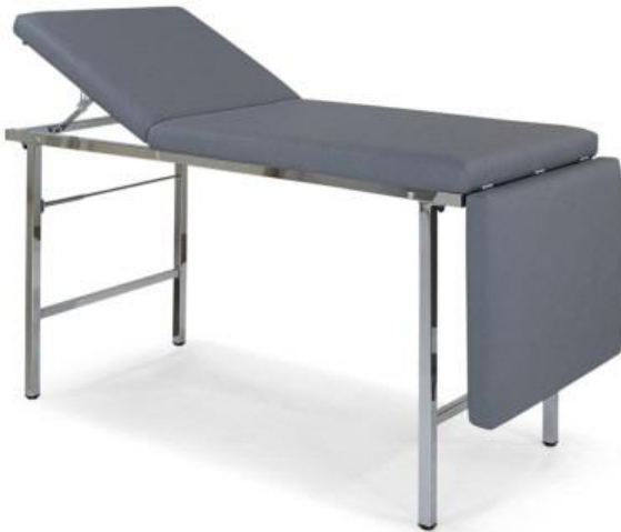
Modell 113-01 mit Ausstattungsoption: Papierrollenhalter (1210)