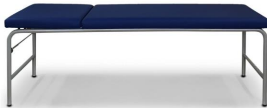
106-... mit Ausstattungsoption: Papierrollenhalter (1210)