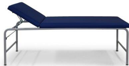
106-... mit Ausstattungsoption: Papierrollenhalter (1210)