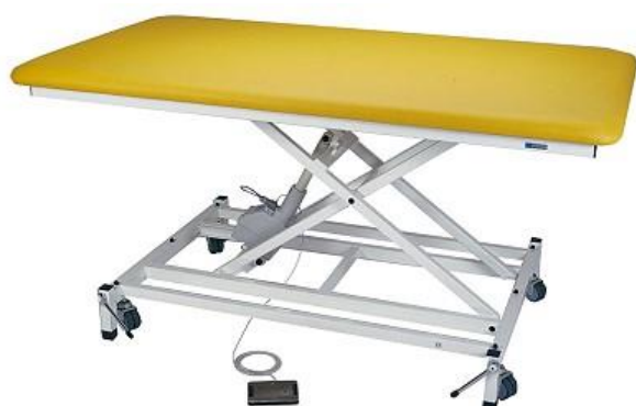
Abb. mit Zubehör: Rad-Hebe-System