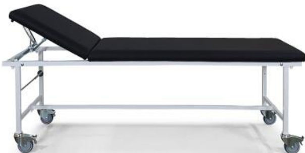
21-00 mit Ausstattungsoptionen: Fahrbar auf einzeln feststellbaren Rollen (1120-10), Längsverstrebung (1310), Papierrollenhalter (1210)