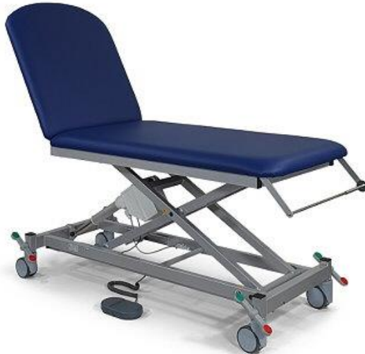
2030-04XLE mit Ausstattungsoption: Fahrbar auf zentralfeststellbaren Doppelrollen (1180N), Papierrollenhalter (1270F)