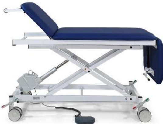
Abb. blau: 2010-00XLE mit Ausstattungsoptionen: Fahrbar auf 4 Comfort- Doppelrollen mit Zentral- feststellensystem (1185), Papierrollenhalter (1270K)

Technische Daten: • Höhenverstellbereich: o Elektromotorisch (Modell 2010-..XLE, 2011- ..XLE): 530 mm bis 970 mm o Hydraulisch (Modell 2010-..XL/H, 2011-..XL/H): 550 mm bis 970 mm • Gesamtlänge der Liegefläche: min. 1.550 mm – max. 1.950 mm • Gesamtbreite der Liegefläche: Modell 2010-..XLE, 2010-..XL/H: 700 mm Modell 2011-..XLE, 2011-..XL/H: 800 mm • Belastbarkeit (bei senkrecht abgeklapptem Fußteil): 250 kg