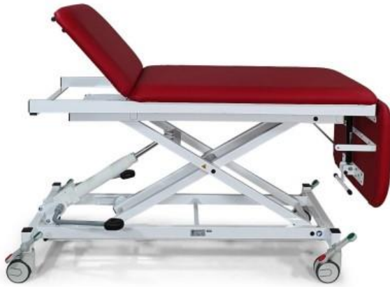
Abb. rot: 2010-00XL/H mit Ausstattungsoptionen: Fahrbar auf 4 Doppelrollen mit Zentralfeststellensystem (1180N), Papierrollenhalter (1270F)