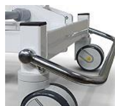
Art.-Nr. B1199 Fußbügel zur zentralen Bremsbetätigung am Fußende