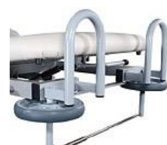
Art.-Nr. B011K / B013K Papierrollenhalter, Befestigung unter dem Kopfteil, für Liegenbreite 700 mm / 800 mm