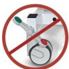
Art.-Nr. 1181 Entfall der serienmäßigen Fahrbarkeit