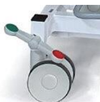
Art.-Nr. B1185 Fahrbar auf 4 Comfort-Doppelrollen mit Zentralfeststellsystem, Ø 125 mm, Grundhöhe + 30 mm