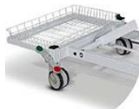
Art.-Nr. B1850 Ablagekorb mit Halterung, Abmessungen: L. 530 x B. 370 x H. 80 mm