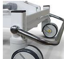
Art.-Nr. B1199 Fußbügel zur zentralen Bremsbetätigung am Fußende