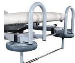
Art.-Nr. B011K / B013K Papierrollenhalter, Befestigung unter dem Kopfteil, für Liegenbreite 700 mm / 800 mm