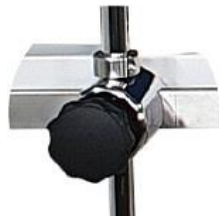
Art.-Nr. B1430 1 Befestigungskloben für Normschiene, Aufnahme passend für Rohr-Ø 18 mm