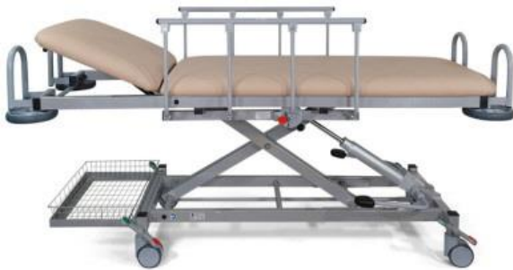
1090-04/H mit Zubehör: Ablagekorb mit Halterungen (B1850)