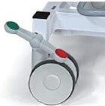
Art.-Nr. B1185 Fahrbar auf 4 Comfort- Doppelrollen mit Zentralfeststellsystem, Ø 125 mm, Grundhöhe + 30 mm