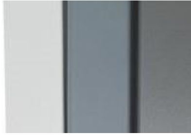
Von links nach rechts: weiß, weißaluminium, graualuminium

Zur Konfiguration des Liegengestells / Rahmens stehen Ihnen, je nach Modell, die Farben weiß (RAL 9010), weißaluminium (RAL 9006) und graualuminium (RAL 9007) zur Auswahl. Auf Wunsch sind weitere Farbtöne möglich. Kontaktieren Sie uns gern!