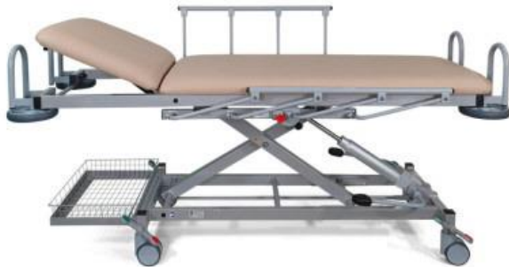
1090-04/H mit Zubehör: Ablagekorb mit Halterungen (B1850)