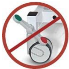
Art.-Nr. 1181 Entfall der serienmäßigen Fahrbarkeit