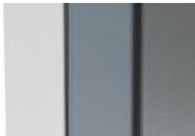
Von links nach rechts: weiß, weißaluminium, grau-aluminium

*Abweichungen zwischen den abgebildeten Farben und dem Original sind aufgrund differierender Monitor-/Grafikkarteneinstellungen möglich.